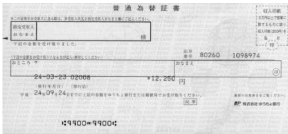
三陸鉄道本社に送付した 12,250 円分の郵便為替